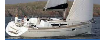
Loarwenn, Sun Odyssey 36i (2007) Lombard - 10,94 x 3,59 - 3 cabines Poids lége 5700 kg - T.E. 1,94 quille fonte